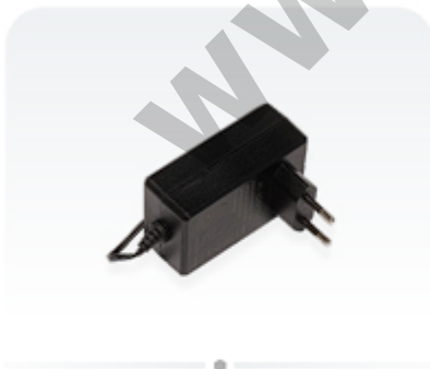
48 V 0.95 A power adapter